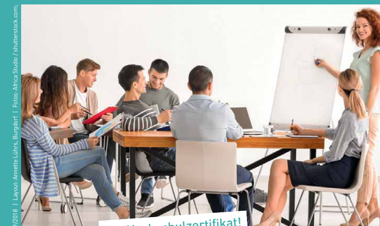
09/2018 | Layout: Annette Lührs, Burgdorf | Fotos: Africa Studio / Shutterstock.com;